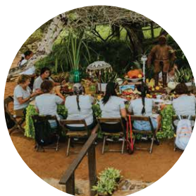
VIAJES DE INCENTIVO